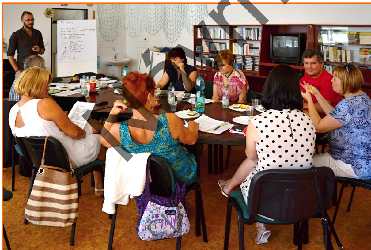
Obrázek č. 1: Setkání pracovní skupiny Šance

PS na svých jednáních došla k následujícím závěrům: Školy se principiálně společnému vzdělávání a s tím souvisejícím reformám nebrání. S integrovanými dětmi a žáky mají své zkušenosti (v řadě případů bohaté) a disponují kvalitními a přinejmenším mimo oblast společného vzdělávání dostatečně kvalifikovanými pedagogy. Zásadní výhrady však mají vůči způsobu, jakým jsou (nebo spíše nejsou) reformy projednávány, a vůči kvalitě transpozice těchto reforem do legislativy a praxe. Ke změnám v legislativě, souvisejících normách a od nich odvíchaného financování dochází neustále a školy a jejich zaměstnanci bez právních oddělení v zádech na tyto změny reagují se zpožděním, značnými náklady a po svém, ne vždy správně a k prospěchu dětí, resp. žáků a vůbec všech zúčastněných stran. Nastavení systému je nejisté, a to i v horizontu kratším než jeden rok. Informovanost a metodická